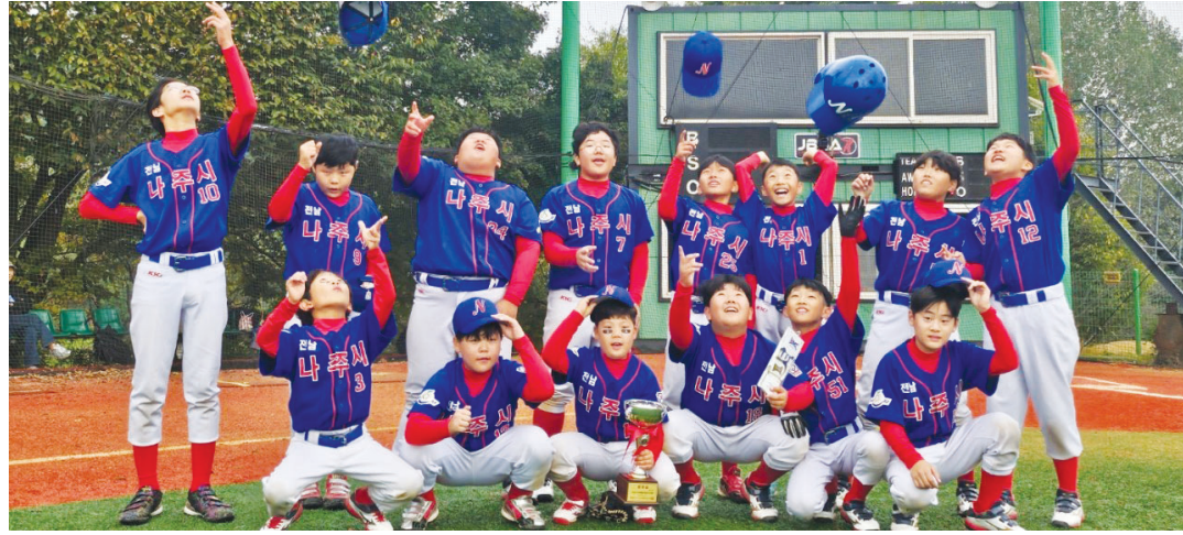
창단 3개월 만에 전국클럽대학야구대회에서 준우승한 나주시리틀야구단.

지 않고 잘 따라주고 있어요. 내 이름을 달고 뛰는 만큼 열심히 해야 한다'고 지도하고 있습니다.”