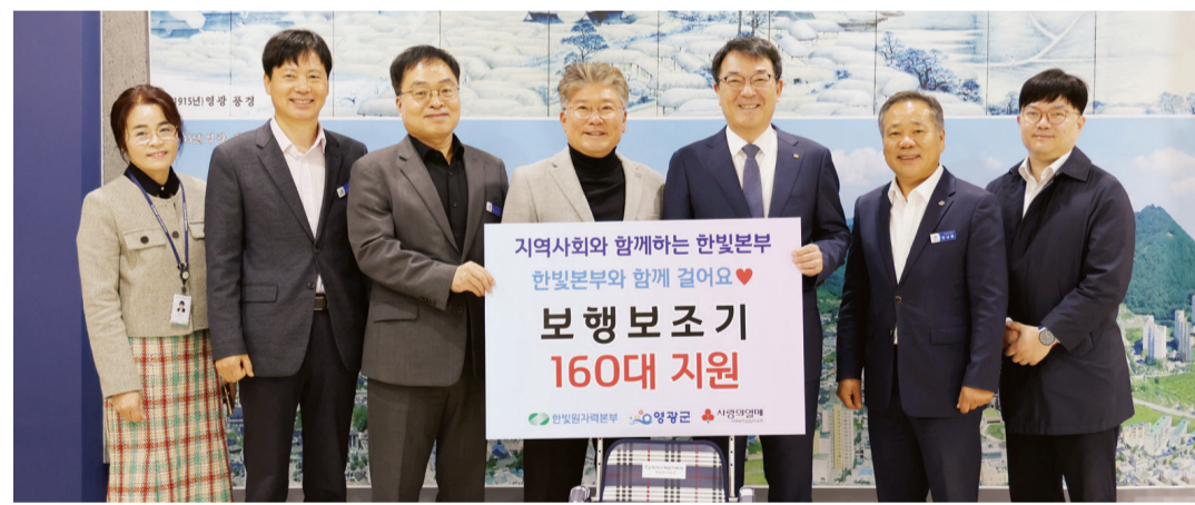
한빛원자력본부는 5일 영광군청에서 영광지역 취약계층 어르신을 위해 2000만 원 상당의 보행 보조기 160대를 전달했다.