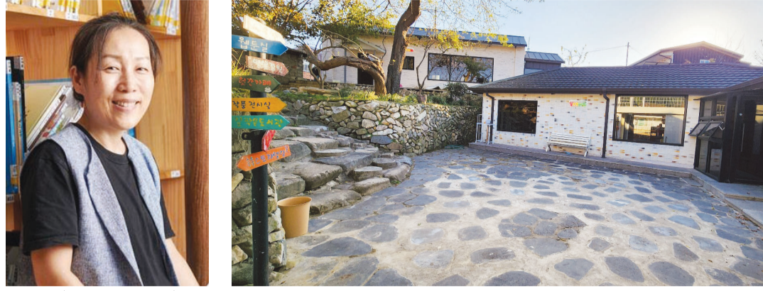
김선자 '길 작은 도서관' 관장과 도서관 전경.

만한 선행과 미담 사례를 발굴해 시상한다. “오랫동안 도서관을 운영하면서 힘들 때도 많았습니다. 앞날을 알 수 없어 막막한 때도 있었죠. 사립도서관이라는 이유로 지원 등을 제대로 받지 못할 때는 아속하기도 했고요. 이번 수상으로 큰 위로와 격려를 받은 기분입니다.” 김 관장은 “퇴직금을 중도 인출해 운영 비용을 마련하는 등 힘들 때도 많았지만 곁에서 늘 함께 해주신 아이들이 많았기에 포기하지 않고 지금까지 달려올 수 있었다”고 말했다. 목회자인 남편과 함께 곡성에 등지를 튼 김 관장은 아이들과 어르신들의 삶을 연결시키는 ‘다리 역할’을 하고 싶다는 마음을 늘 갖고 있었다. “제가 할머니 할아버지를 참 좋아했는데 막상 두 분을 위해 무언가를 해드릴 수 있는 나이가 됐을 때는 세상을 떠나셨죠. 두 분에게 해드리고 싶었던 것들을 떠올리며 동네 할머니들에게 필요한 것이 무엇일까 고민했어요. 그렇게 시집과 그림책이 나왔죠. 또 할머니들의 이야기를 아이들에게 들려주고