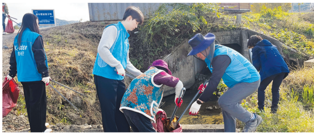
한국수자원공사 영·섬유역관리처는 5일 주암댐 상류인 보성군 울변마을에서 '2024년 영·섬유역 도랑살리기 사업의 일환으로 합동 정화활동을 실시했다.