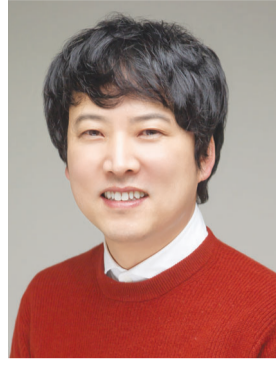
있어요. 더불어업사이클링 제품과 접목해 환경 인식을 개선하고 싶습니다.”

에 의뢰해 장애인식 교육을 한다. 그에게 가장 중요한 가치는 ‘사람’이다. 퇴직금도 없이 퇴사한 아픈 경험이 있는 그는 ‘내가 직원을 뽑으면 무책임하게 내보내지 않고, 또 이들이 창업할 수 있도록 가르쳐줘야겠다’고 생각했다. 20년 간 디자인 분야에서 일하던 그는 2018년 광주 사회적경제 창업 아이디어 대회에서 입상하며 창업했고, 2021년 사회적기업으로 인증받았다. 사회적기업에 걸맞게 그는 지역아동센터, 독거노인들에게 지속적으로 관심을 쏟는다. 당시 동구 인쇄거리에서 회사를 운영했던 임 대표는 인쇄할 때 나오는 폐자재를 활용해 수업 교구를 만들며 장애인 인식 개선을 위한 캐릭터와 제품을 개발한다. 장애를 이겨낸 위인들을 모티브로 만든 G-BOT(Great Robot)으로 한국캐릭터문화협회 회장상을 수상하기도 했다. “장애인에겐 희망 메시지를, 비장애인에겐 장애를 올바르게 볼 수 있는 메시지를 제공하고 싶