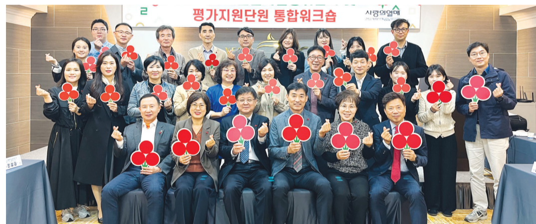
전남사회복지공동모금회는 최근 여주시 JCS호텔에서 배분분과실행위원회 및 평가지원단과 함께 2024년 배분분과실행위원회 및 평가지원단 통합워크숍을 진행했다.