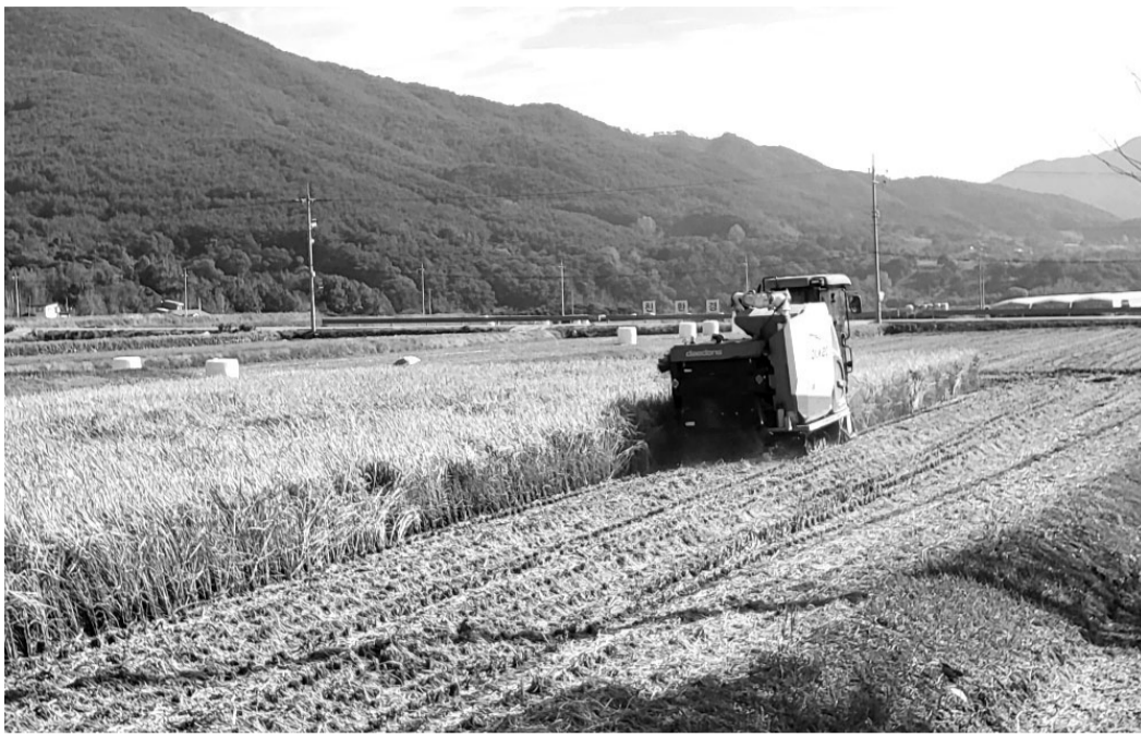
벼 수확할 콤바인을 통해 탈곡한 벼짚을 기계 안에서 잘라 눈에 깔아놓는 벼짚환원작업 모습.

벼짚 환원은 콤바인을 이용해 벼를 수확할 때 탈곡한 벼짚을 일정 간격으로 잘라 그대로 눈에 깔아 놓는 것을 말한다. 벼짚에는 양질의 유기물과 양분(질소·인산·칼리·규산·석회 등)이 있는데, 이러한 유기물에 의해 토양의 통기성과 배수성을 좋게 하는 효과도 있어 지력을 높이는 최고의 농법이