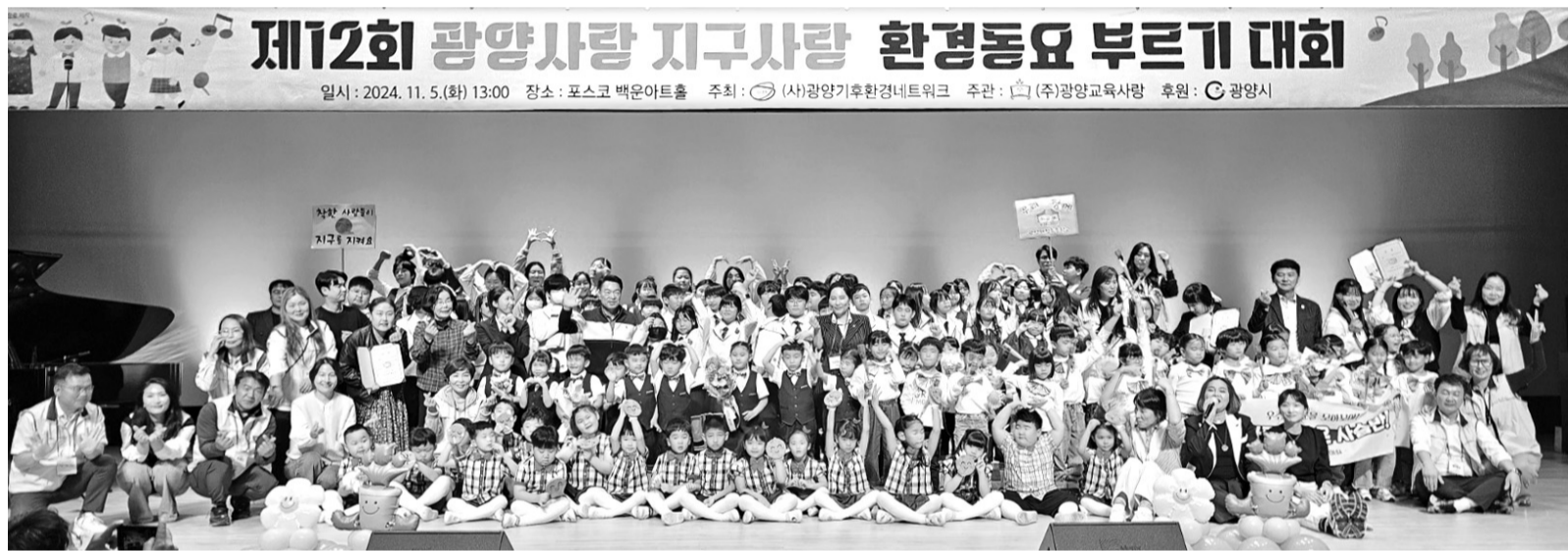
‘제12회 광양사랑 지구사랑 환경동요 부르기 대회’가 지난 5일 포스코광양백운아트홀에서 유아·어린이 500여명이 참석한 가운데 성황리에 막을 내렸다.