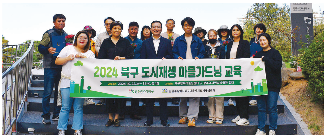
(사)광주시북구마을자치도시재생센터는 최근 광주역사민속박물관과 연계해 '2024 북구 도시재생 마을 가드닝 교육'을 진행했다.