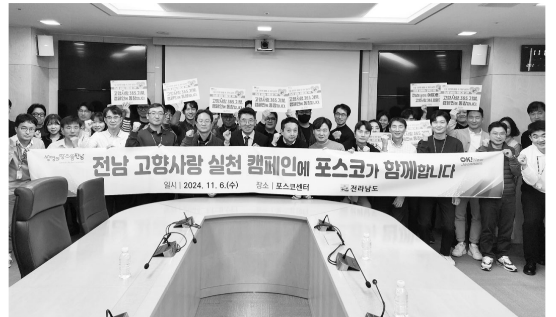
지난 6일 전남도가 서울 포스코센터를 찾아 전남 고향사랑기부제 홍보 캠페인을 벌인 뒤 직원들과 기념촬영을 하고 있다.