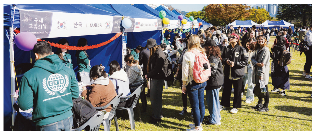
전남대학교 외국인 유학생들은 지난 6일 국제 교류의 날(CNU International Day) 행사에서 교류와 소통의 시간을 가졌다.