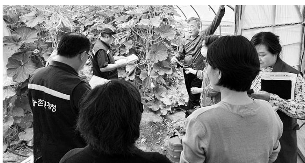
지난 8~9월 폭염 때문에 발생한 고창지역 ‘단호박’ 시설농가 착과불량 피해에 대해 군과 농식품부의 합동조사가 진행 중이다.

하분밭아 부족·낙화 등 전년비 90% 이상 수정불량 130여 농가 손해배상 적용