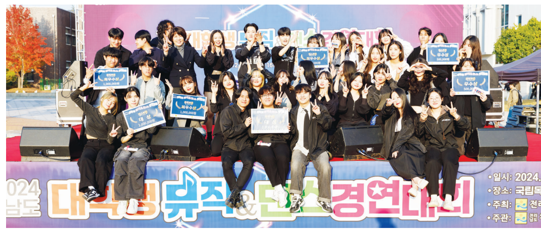
전남도가 주최하고 전남청소년미래재단이 주관한 '2024 전남 대학생 뮤직&댄스 경연대회'가 지난 12일 국립목포대에서 열렸다.