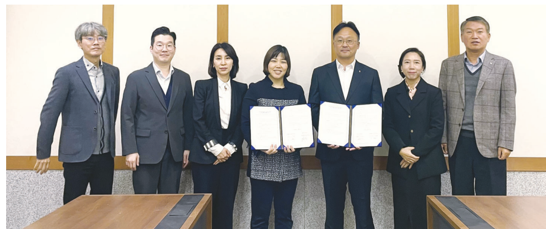
광주여자대학교 MAUM교육원은 지난 15일 해남문화관광재단과 마을 교육 활성화 협력과 문화·관광 전문인력 양성을 위한 교육 활동 지원 등 산학협력을 위한 업무협약을 체결했다.