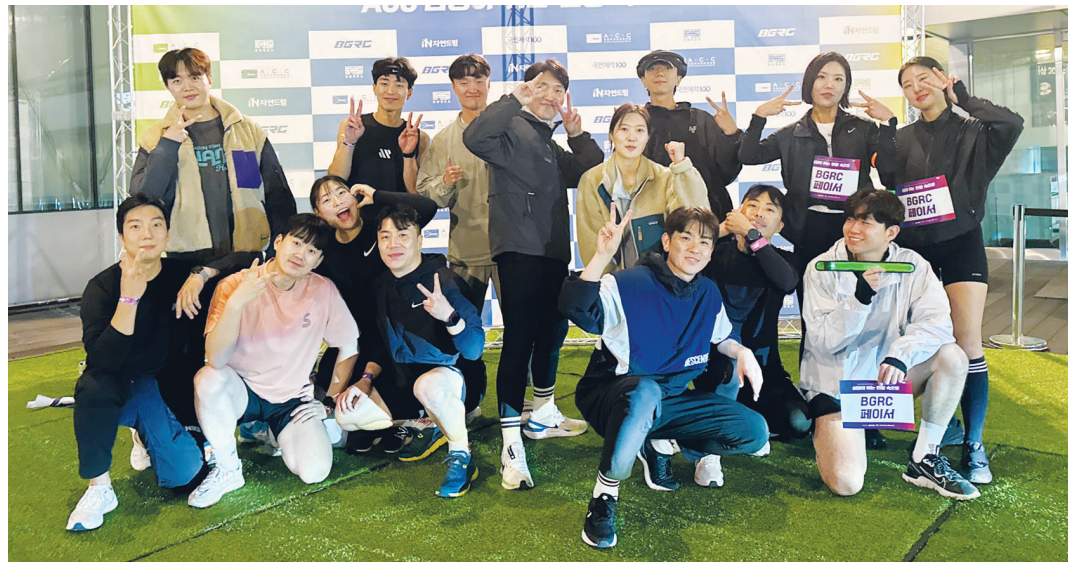
'BGRC(Bitgoeul Running Crew-비잘씨)'는 국립아시아문화전당을 중심으로 도시를 달린다. 지난 9일 열린 '심장이 뛰는 현장 속으로'.

린다. 전당 앞 5·18 민주광장 분수대에서 시작해 예술의 거리, 금남지하상가, 광주 천변이 주 코스다. 현재 회원은 70여명으로 보통 20-30명이 함께 댈다. 회원은 20대부터 40대까지 다양하며 회비 없이 인스타그램이나 카카오톡 오픈톡을 통해 가입한 후 달리기 참여하면 된다. 전문 큐레이터의 해설을 들으며 전시를 관람하고 전당 곳곳의 2.5km를 함께 달린 행사는 참가자들에게도, 회원들에게도 색다른 경험이었다. "그냥 달리는 게 아니라 전시가 함께 어우러져 재미있었다는 반응들이 많았어요. 나도 뛰고 싶다고 하는 분들도 많았어요. 사실, 지금까지는 전당의 존재나 이곳에서 이뤄지는 전시에 관심을 갖지 않았는데 이번 행사를 통해서 새로운 공간을 발견할 수 있어 좋았다고 하더군요. 저 역시 마찬가지고요." 70여명이 함께 한 이번 행사에서는 예술극장 빅도어에서 출발해 동구청 방향 계단, 분수대, 하늘마당 등을 달렸다. 통풍과 부상을 방지하기 위한 근력보