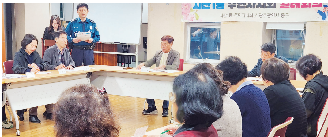
광주동부경찰(서장 강기현)은 최근 지산1동 주민자치회 정례회의에서 지산자율방범대·산수파출소와의 합동순찰, 무등산 리프트카 및 모노레일 시설 점검 등 10월 범죄예방 활동을 공유했다.