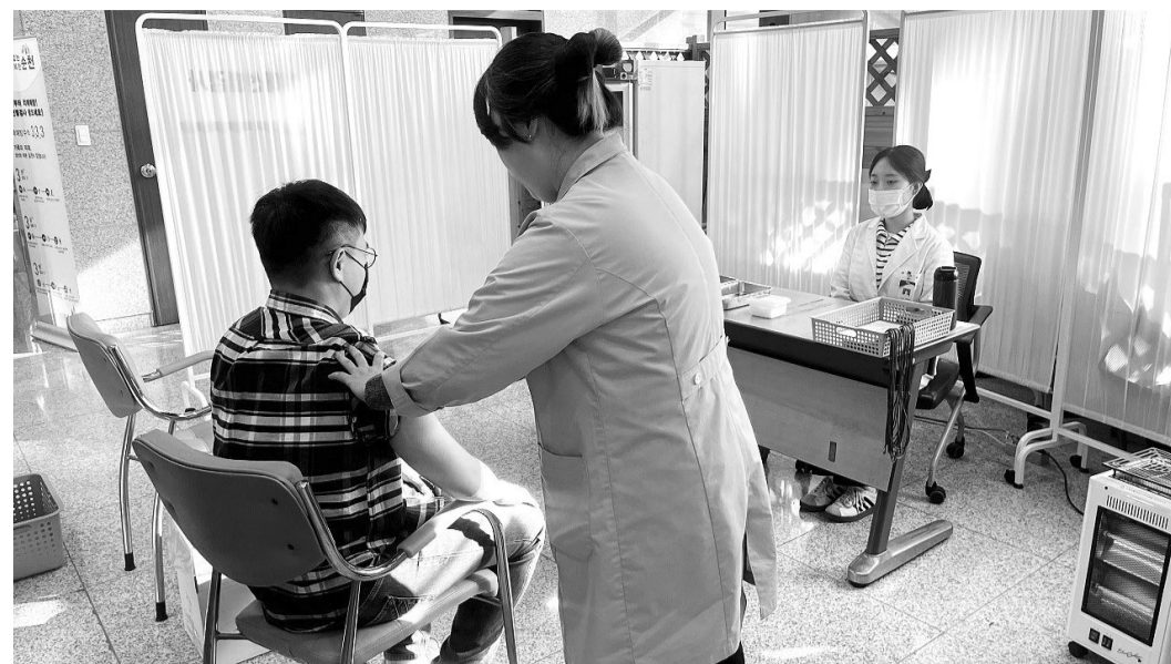
순천시 대상포진 예방접종 지원 대상자를 65세 이상에서 55세 이상으로 확대했다.

5년간 바다를 조망하는 '친환경 트레일', 바닷속을 들어 온 듯한 실감형 미디어아트 '마래아트터널', 액티비티와 휴식이 공존하는 '마래아일랜드' 등을 조성하게 된다. 또 여수관광통합 앱 '여수엔' 플랫폼과 연계해 온라인 관광 정보와 예약 서비스를 제공하고, 디지털 관광콘텐츠-마케팅을 강화할 방침이다. 여수시 관계자는 "이번 사업이 완료되면 일레븐 브리지와 여수-남해 간 해저터널과 맞물려 지역 관광의 큰 전환점이 될 것"이라며 "앞으로도 지속 가능한 관광정책을 펼쳐 경제 효과 극대화하고, 지역 주민들의 삶의 질 향상에 기여하겠다"고 말했다. /여수=김창화 기자·동부취재본부장 chkim@