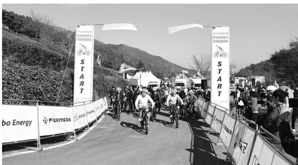
제1회 보성군수배 전국산악자전거 및 국민라이딩 대회가 제암산 휴양림 일원에서 이틀간 열렸다.

단풍으로 물든 산길을 헤치며 짜릿함을 만끽하는 산악자전거의 질주가 펼쳐졌다. '제1회 보성군수배 전국산악자전거 및 국민라이딩 대회'가 지난 16일부터 이틀간 제암산자연휴양림 일원에서 전국 산악자전거 선수·동호인 500여 명이 참가한 가운데 성황리에 열렸다. 보성군 후원·한국산악자전거연맹 주관의 이번 대회는 국민라이딩 코스 10km·다운힐 1.4km·크로스컨트리 3개 부문으로 나누어 진행됐다. 대회 첫째 날인 16일은 개회식을 시작으로 누구나 참여할 수 있는 국민라이딩 코스 10km 대회와 현란한 스킵을 즐길 수 있는 다운힐 1.4km 경기가 펼쳐졌다.