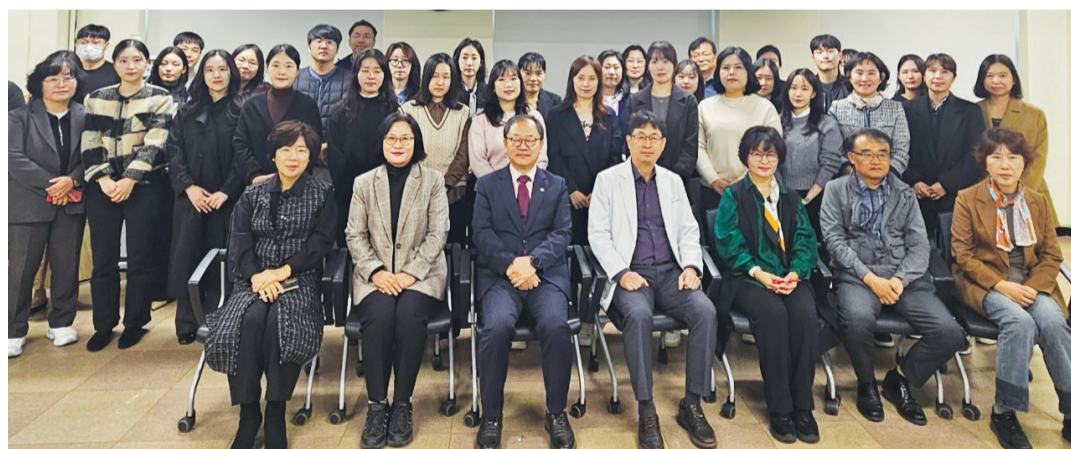
전남도가 최근 국립나주병원에서 시민금융지원센터, 고용복지플러스센터, 정신보건복지센터 관계자가 참석한 가운데 중장년층 극단적 선택 예방을 위한 '금융-고용-정신건강 연계 협업 간담회'를 개최했다.