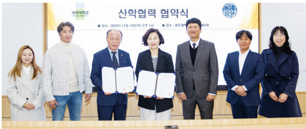
광주대학교(총장 김동진) 반려동물보건산업학과는 지난 14일 (사)한국애견연맹(총재 송하경)과 반려동물보건산업 분야 현장 실무형 창의 인재 양성을 위한 산학협력 업무협약을 체결했다.