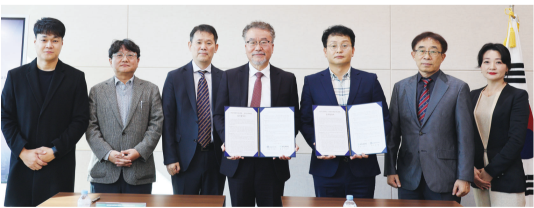
광주교육대학교는 최근 (주)창의융합인재교육원과 함께 교과 및 비교과 영역 AI·에듀테크 기반의 혁신적인 교육 프로그램 개발과 초·중·고 학교 프로그램 운영을 위한 업무협약을 체결했다.