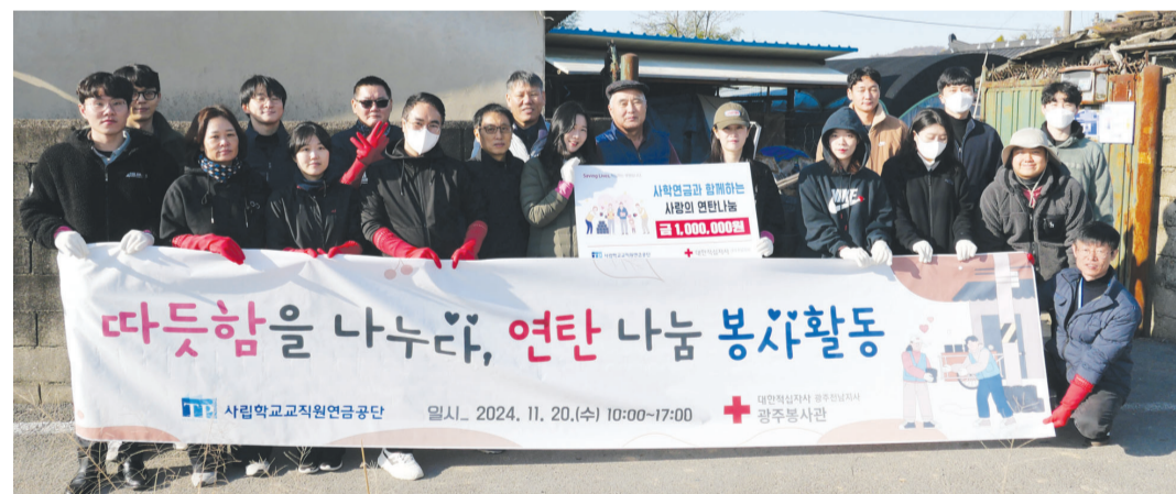
사학연금교직원연금공단이 최근 대한적십자사 광주전남지사와 함께 연탄 900여 장을 광주 분량동 취약계층에게 전달했다.