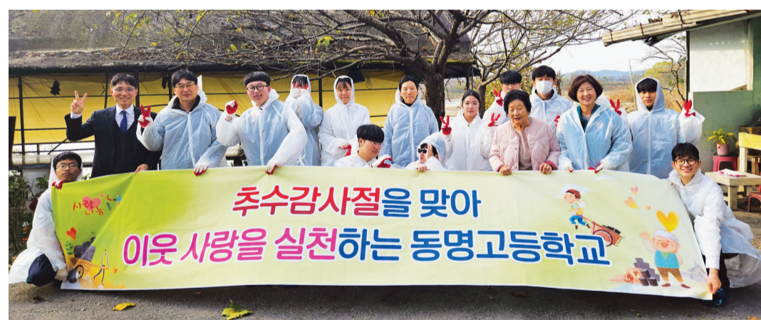
광주 동명고등학교 학생과 교직원들은 최근 십시일반 모은 성금으로 마련한 연탄 1000여 장을 독거 어르신 가정 5곳에 배달했다.