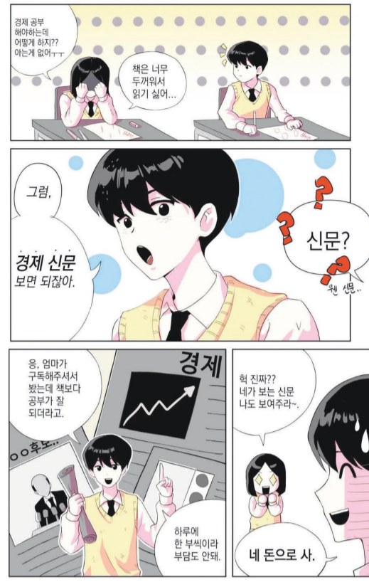
강주은 양이 수상한 웹툰 작품.