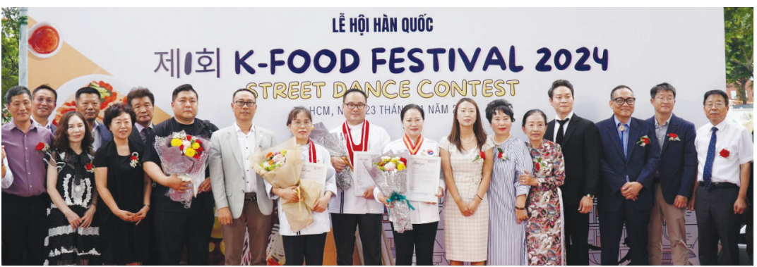
K-푸드문화연구소는 지난 23일 베트남 흥방국제대학교에서 개최된 제1회 베트남 K-FOOD한식요리경연대회에서 교민 300여명과 함께 한국전통음식 전시와 시식 행사를 가졌다.