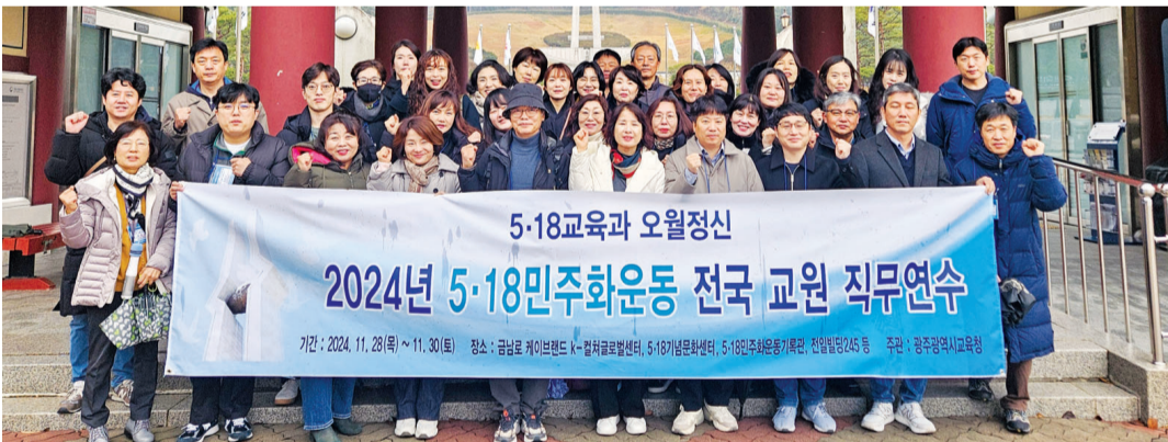
광주시교육청은 지난 28일부터 2박3일 동안 타 시도 초·중·고등학교 교원과 교육전문직원 등 34명이 참여한 가운데 '2024년 5·18민주화운동 전국 교원 직무연수'를 개최했다.