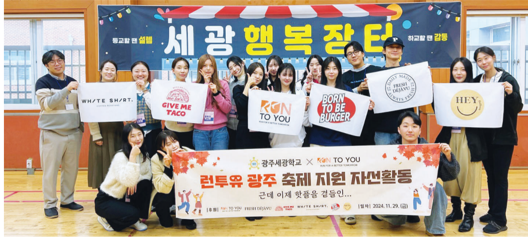
지난 29일 시각장애 특수학교 '광주세광학교' 축제에서 자선 활동을 펼친 러닝크루 '런투유광주' 팀.