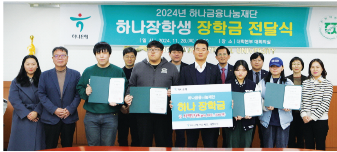
하나금융재단이 최근 전남대 여수캠퍼스에 장학금 400만 원을 전달했다. 재단은 지난 2018년부터 지금까지 모두 24명에게 2400만원을 지급했다.