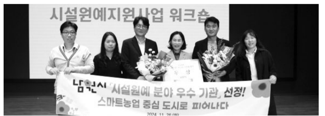
남원시 관계자들이 시설원에 지원사업 워크숍에서 우수 지자체 선정된 후 기념 사진을 찍고 있다.

남원시가 농림축산식품부의 '시설원에 지원사업 지자체 평가'에서 우수 지자체로 선정됐다. 남원시는 스마트농업 중심도시로서의 위상을 높이기 위해 다양한 스마트농업 기술 지원 사업을 펼치고 있다. 시 농업기술센터는 지역특화품목 비닐하우스 지원, 시설원에 현대화 사업, 원예분야 정보통신 기술(ICT) 융복합 지원 사업 등 9개 분야에 대한 내년도 지원 사업 신청 접수를 받는 등 스마트농업 발전을 위해 힘쓰고 있다. 이러한 공로를 인정받은 시는 우수 지자체 선정