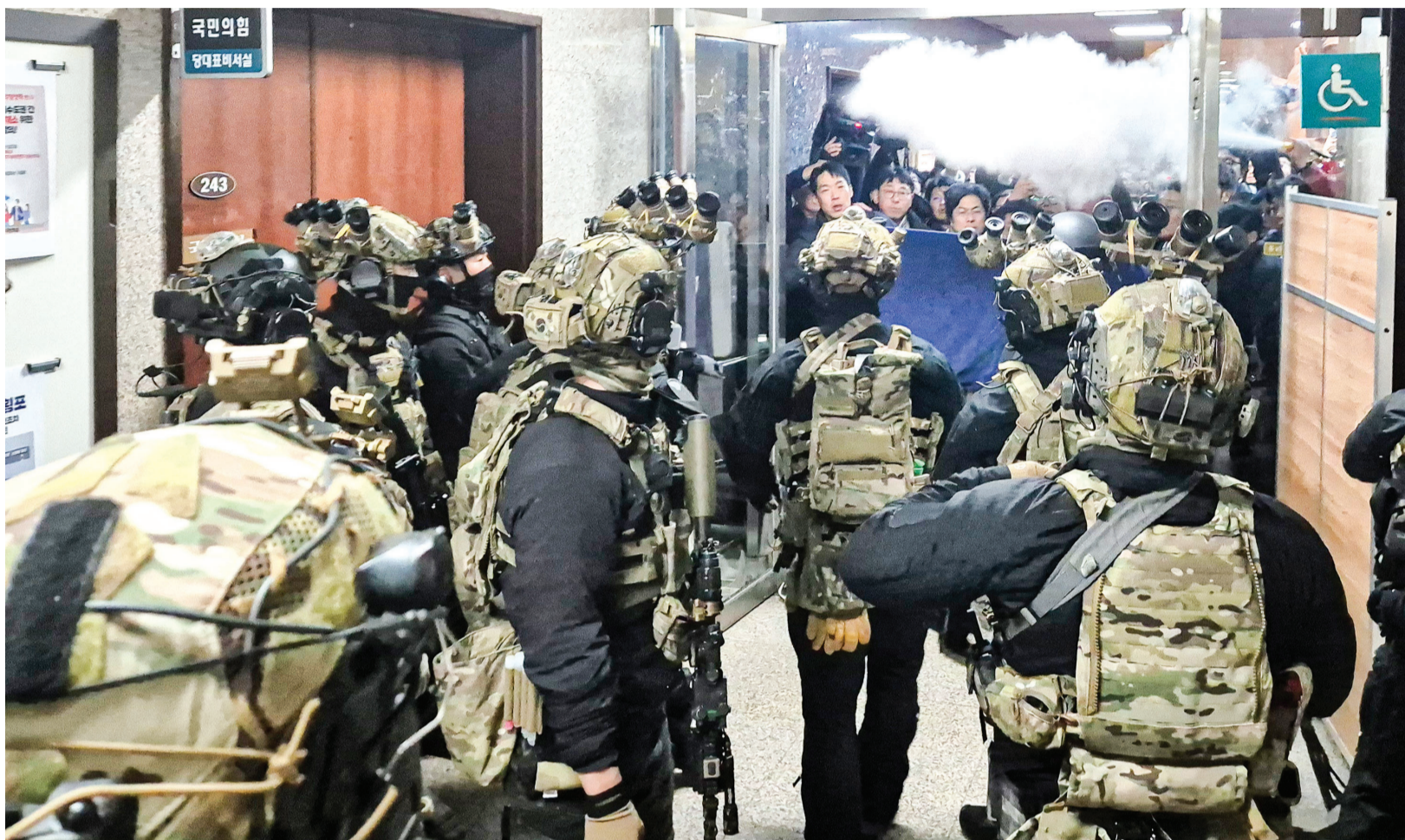
윤석열 대통령이 3일 저녁 비상계엄을 선포한 가운데 4일 새벽 서울 국회의사당에서 계엄군이 국회 본청으로 진입하고 있다.

이울러 “자유민주주의의 기반이 돼야 할 국회와 자유민주주의의 체제를 붕괴시키는 괴물이 된 것”이라 며 “지금 대한민국은 당장 무너져도 이상하지 않을 정도의 풍전등화의 운명에 처해 있다”고 강조했다.