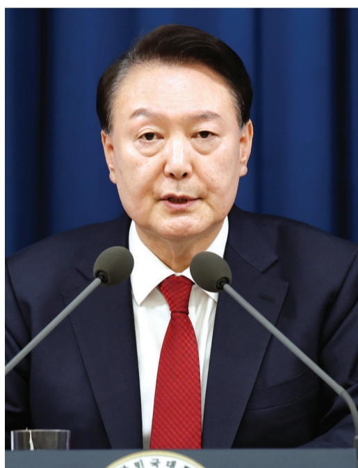
윤석열 대통령이 3일 밤 서울 용산 대통령실 청사 에서 긴급 대국민 특별 담화를 하고 있다.

력을 적절하고 국가를 정상화시키겠다”며 “계엄 선 포로 인해 자유대한민국 헌법 가치를 믿고 따라주 신 선량한 국민들께 다소의 불편이 있겠지만 이러 한 불편을 최소화하는 데 주력할 것”이라고 덧붙였다. 또 “대통령으로서 국민 여러분께 간곡히 호소 드린다. 저는 오로지 국민 여러분만 믿고 신명을 바 쳐 자유대한민국을 지켜낼 것”이라며 “저를 믿어주 십시오”라고 당부했다.