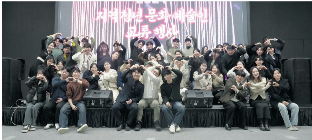
문화체육관광부 국립아시아문화전당(전당장 이강현)은 최근 문화정보원 국제회의실에서 ‘2024 지역청년문화예술인 교류행사’를 개최했다.