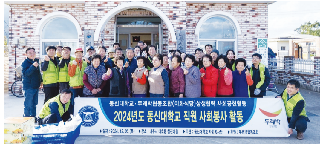
동신대학교 직원사회봉사단이 최근 대학 구내식당인 이화식당(두레박협동조합)과 함께 나주시 대호동 칠전마을을 방문해 도시락 배달봉사활동을 진행했다.