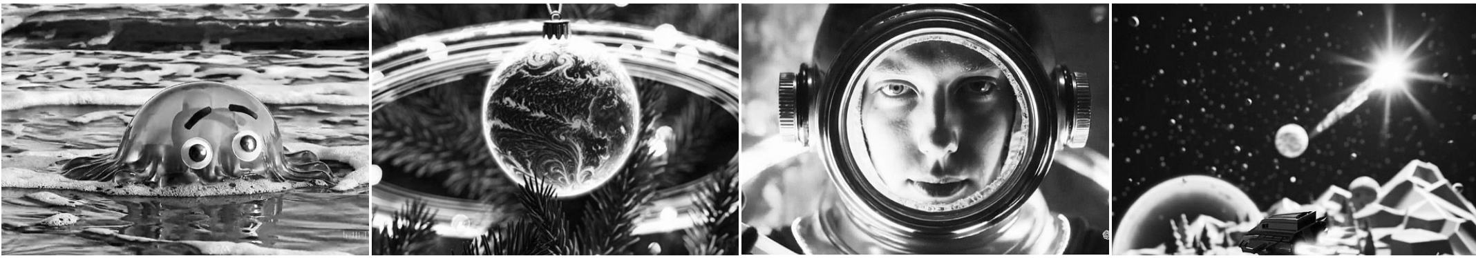
오픈AI가 본격 출시한 동영상 생성 인공지능 모델 '소라(Sora)'.