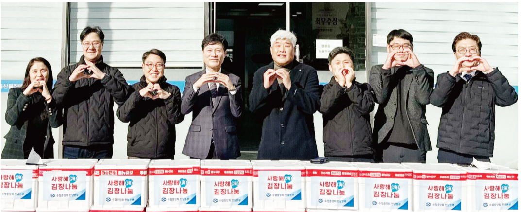
수협중앙회 전남본부는 11일 광주김치타운에서 전남본부 직원 등 행복봉사단 20여명이 참여해 '2024 사랑해(海) 김장 나눔 봉사활동'을 펼쳤다.