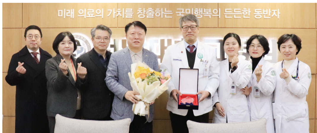
대한적십자사 광주·전남혈액원(원장 김동수)은 지역 내 헌혈문화 확산에 기여한 공로로 전남대학교병원(원장 정신)에 감사패를 수여했다.