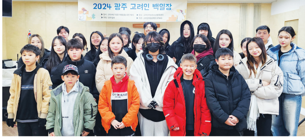
지난 13일 광주 고려인마을 청소년문화센터에서 '2024 광주 고려인 백일장'이 열렸다. 대회에 참가한 고려인마을 학생들의 모습.

길 수 있어 행복하다는 감상을 실었다. 다양한 K-콘텐츠를 통해 공부했기에 "한글을 배우는 시간이 다른 나라 언어보다 짧게 느껴졌다"는 것이다.