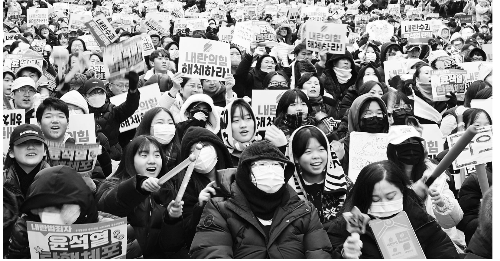
윤석열 대통령에 대한 두 번째 탄핵소추안 국회 표결이 이뤄진 지난 14일 오후 광주시 동구 금남로에서 열린 '윤석열 정권 즉각 퇴진 광주비상행동'의 집회에서 시민들이 퇴진 촉구 구호를 외치고 있다.

게진이 계속되고 있다는 점에서도. 아직도 온라인에서 유머와 현실을 적절하게 섞은 '밈'(meme·인터넷 유행 콘텐츠) 등을 통해 윤 대통령의 파면요구가 이어지고 있다는 것이다.