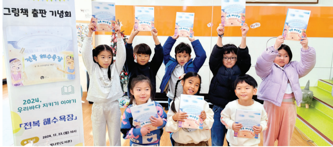
그림책 ‘전복 해수욕장’을 만든 완도 소안초등학교 1학년 학생들.