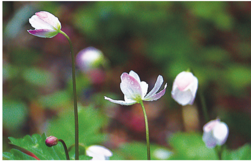
'구례 남바람꽃'.

불처럼 밝고레한 색을 띠는 귀엽고 청초한 꽃. 고결하고 단아한 자태를 지녀 '천진난만한 여인'이라는 꽃말을 가진 꽃. 남쪽 지역에 피는 바람꽃이라 하여 이름 붙은 '남바람꽃'이다. 꽃잎이 없고 꽃받침이 꽃잎처럼 보이는 이 꽃은 앞면은 흰색, 뒷면은 분홍색으로 뒤따가 더 아름답다고 알려졌다. 남바람꽃은 희귀식물 위급종으로 우리지역에는 구례 문정면 급정리 오봉산 자락에 군락지가 있다. 10여 년 전 남바람꽃을 찍기 위해 사진작가들이 몰리고, 시민들의 발길이 이어지며 훼손이 되자 남바람꽃을 아끼는 구례와 광양 주민들이 뭉쳤다. 2019년 우두성 자연생태전문가(위원장), 정연권 야생화전문가, 김인호 사진 작가 겸 시인 등 5명이 모여 '구례남바람꽃보전위원회'를 결성했고 현재 20여 명이 회비로 운영 중이다. “3월말에서 4월초 보통 벚꽃이 지는 시점에 꽃이 피는데 이때가 가장 아름답습니다. 약 10~15일 정도로 짧은 시간 볼 수 있어서 사진 기자들 뿐만 아니라 1000여 명의 시민들이 구경하러 와요. 타지역보다 체계적으로 보존이 잘 돼있고 접근하기 쉬워 구례 남바람꽃 서식지가 인기가 많습니다.”