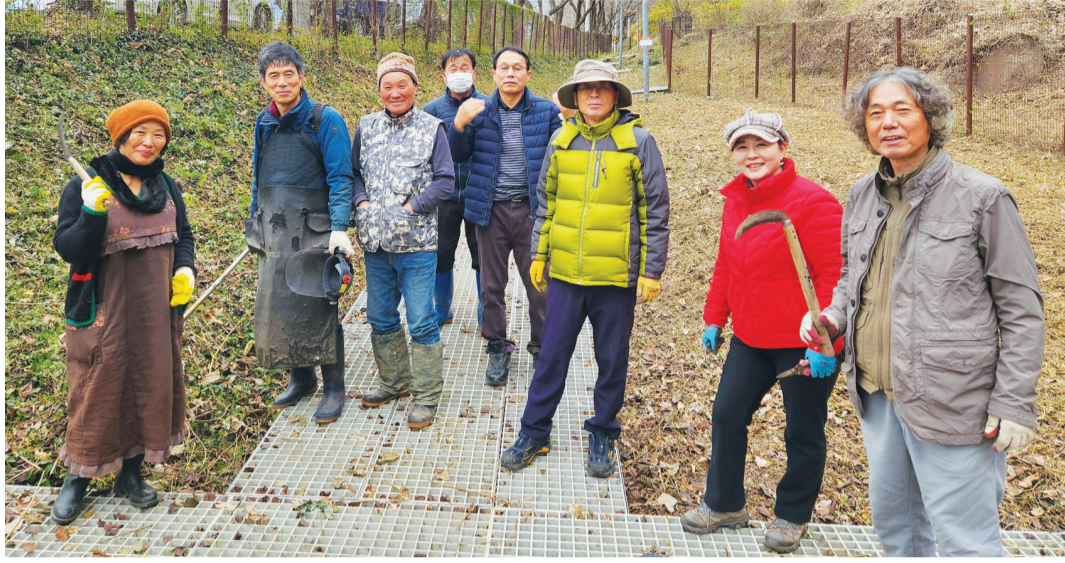
희귀식물 위급종 구례 남바람꽃을 지키는 '구례남바람꽃보전위원회' 회원들.

살랑 스쳐가는 바람처럼 피어나 바람과 친숙한 남바람꽃은 구례의 야생화다. 구례 출신 식물학자 박만규 박사가 1942년 최초로 발견했고, 서식지에서 흔하게 사라졌다가 2014년 72년만에 재발견돼 구례 남바람꽃의 존재가 두각을 나타냈다. 현재 구례, 제주도, 순창, 함안 등에서나 자생하고 있어 적극적인 보호가 필요한 상황이다. 구례군은 150평의 땅을 매입해 남바람꽃 서식지를 마련했으며 펜스를 치고 CCTV 촬영 등을 통해 자생지를 보호하고 있다. 회원들은 꽃이 피는 10일