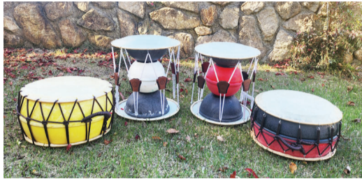
부표 등 해양쓰레기로 만든 장구와 북.

지난 12월 광주시청에서 열린 '2024 광주 지속가능발전 한마당'은 지속가능발전을 주제로 한 다양한 행사들이 마련됐다. 그중 국악 동아리 '천동소리' 팀의 사물놀이 공연이 눈길을 끌었다. 장구, 북, 징, 팽과리, 태평소. 얼핏 보면 우리가 아는 전통악기들이지만, 부표 등 해양 쓰레기를 모아 만든 악기로 선보인 공연이었다.