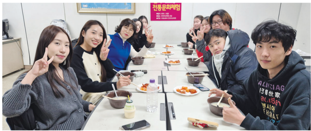
호남대학교 한국어교육원(원장 윤영)은 지난 3일 한국어교육원 연수생을 대상으로 ‘새해맞이 한국 전통놀이와 음식 체험’ 행사를 개최했다.