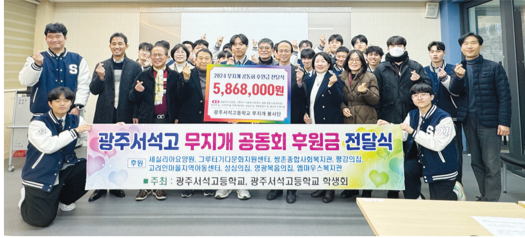
광주서석고 무지개공동회는 최근 지역 사회복지시설에 후원금 586만 원과 물품을 전달했다.