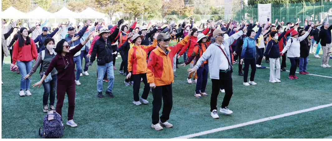
지난해 용산체육관에서 열린 가을 산행에 앞서 동구랑 건강체조를 하고 있는 참가자들.

동구랑 건강체조는 지난해부터 탄력을 받으며 주민들 속으로 들어갔다. 체조 이름 공모를 통해 ‘동구랑 건강체조’라는 이름을 정하고 10월에는 ‘건강도시 주민 100인 토론회’를 진행, 건강체조 활성화