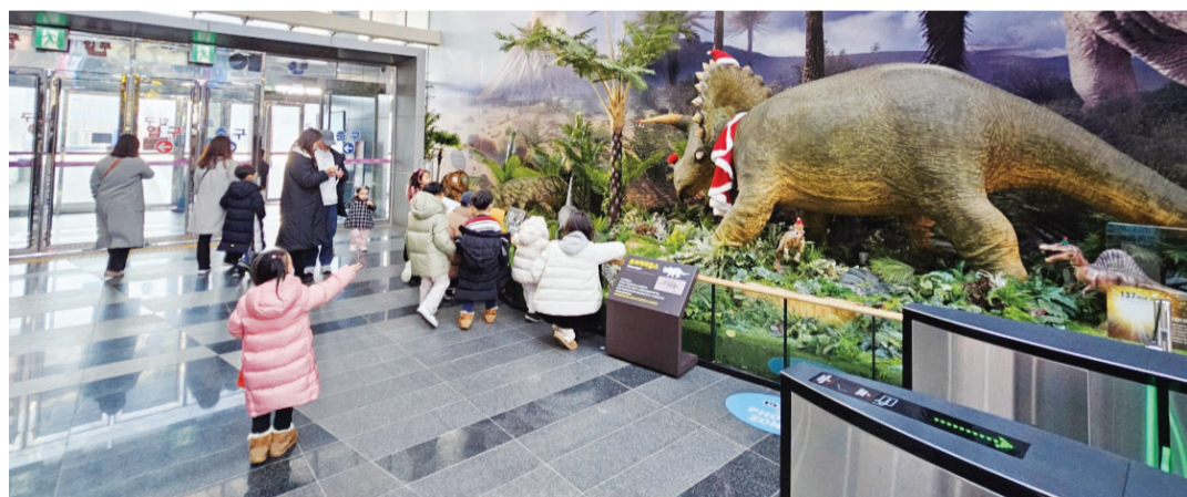
국립광주과학관(관장 이정구)이 본관 1층에 조성된 공룡동산에 움직이는 공룡 3종을 배치하는 등 새롭게 단장했다. <국립광주과학관 제공>