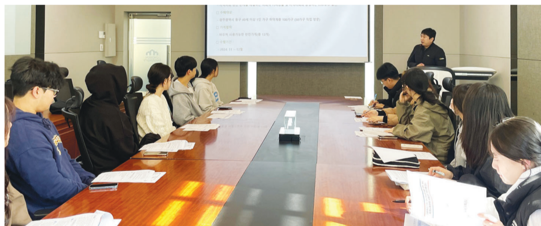
조선대학교(총장 김춘섭)가 ESG경영을 실천하기 위한 노력으로 지역사회와 연계한 ‘1인 가구 대상, 따뜻한 밥상 지원사업’을 실시했다.