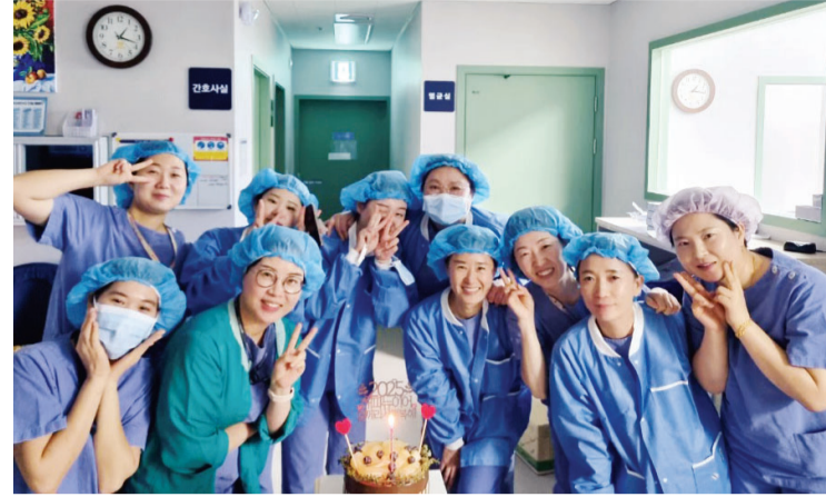
새해를 함께 맞이한 수술실 간호사들.