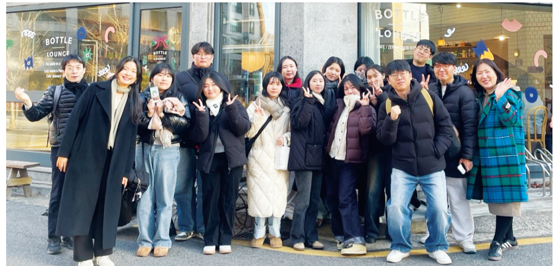
호남대학교 인문사회과학연구소 연구사업단이 최근 서울 연희동 일대에서 글로벌 리더십 함양 비교과 프로그램 중 하나로 ‘무해하고 즐거운 제비의 일상여행’을 진행했다.