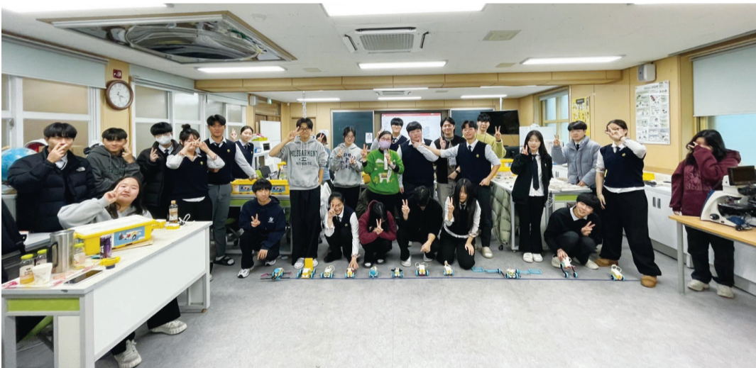
조선대학교가 최근 화순고등학교 1~2학년 학생들을 대상으로 ‘AI·SW 융합 코딩 캠프’를 성황리에 마쳤다.