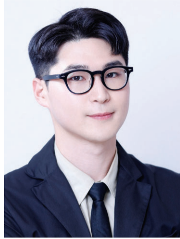
인트레이너가 되고 싶었다.

로봇 코딩 강사인 김씨는 2023년 브레인트레이너 시험을 준비했다. 기계공학을 전공한 그는 국제 뇌교육종합대학원대학교 자료로 생물학과 뇌과학 등을 공부해 1년 여만에 합격했다. 선혜학교 등 특