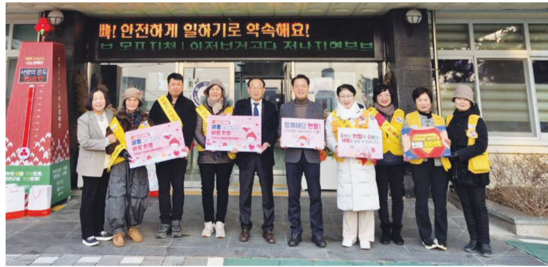
강진군·완도군·503여단 본부·광주환경공단·정부광주합동청사가 14일 대한적십자사 광주·전남혈액원 ‘70일 간 사랑의 단체헌혈 릴레이’에 동참했다.