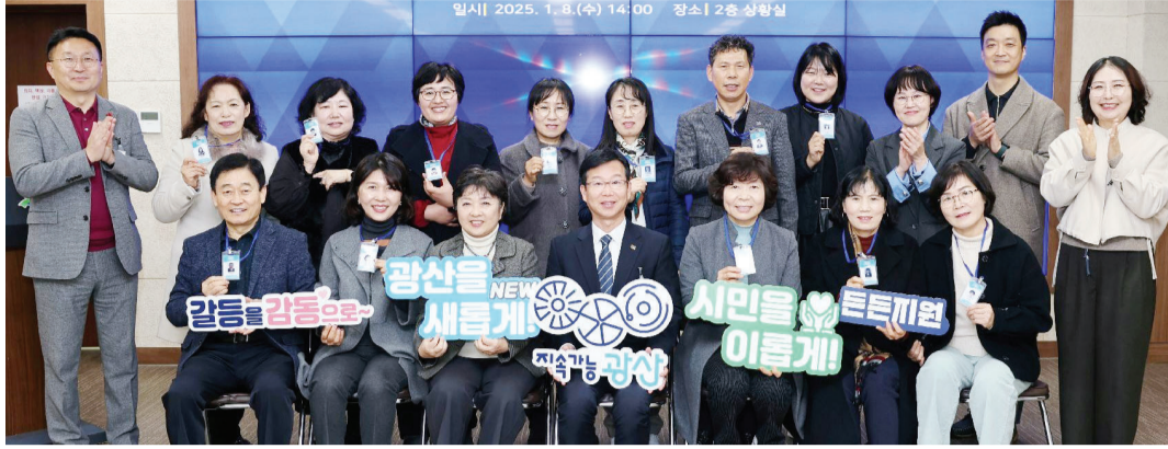
제4기 이웃갈등 조정 활동가 위촉식이 지난 6일 광산구청에서 개최됐다.

이후 피신청인과 예비 상담을 진행, 양측의 동의를 구한 후 다 함께 만나 '본 조정'을 진행한다. 당사자들이 대화로 타협하고 해결점을 찾는 화해 조정이 이뤄지는 단계다. 활동가들은 비밀 유지, 감정에 치우치지 않고 이야기하기, 대화 도중 끼어들지 않지 등 규율을 설명하며 타협점을 찾아나간다. 서로