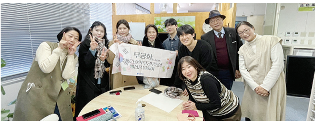
남부대학교 교육혁신처 비교과통합관리센터는 지난 6일부터 12일까지 일본 전역에서 동계 NB 글로벌 두드림 프로그램을 진행했다.