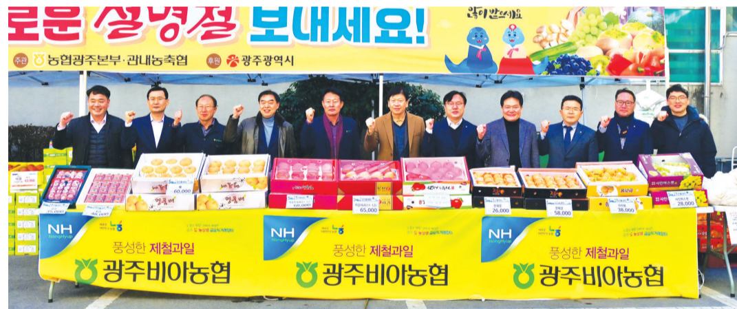
농협 광주본부는 16~17일 본부 주차장에서 15개 지역 농·축협이 생산한 농산물과 과일, 한우선물세트, 제수용품 등을 구매할 수 있는 '설 명절 맞이 우수 농·축산물 직거래장터'를 개장했다.