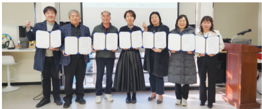
광주서구문화센터와 서창동 마을공동체, 자생 단체 등 7개 단체가 최근 '서창향토마을 활성화'를 위한 업무협약을 체결했다.