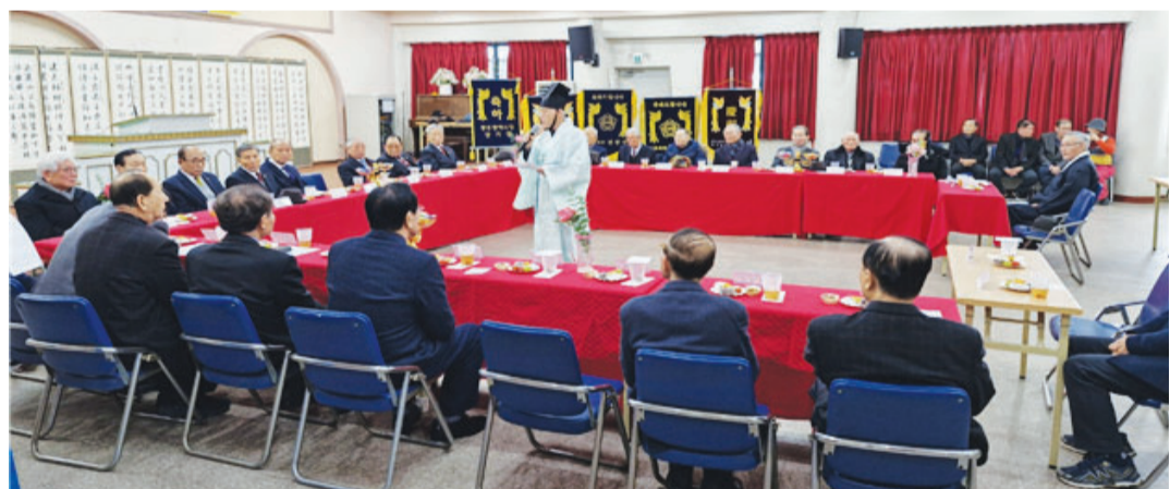
광주향교(전교 기호석)는 4일 광주시 전교를 비롯한 유림 원로와 유관 단체 관계자들이 참석한 가운데 을사년 신년 하례회를 개최했다.