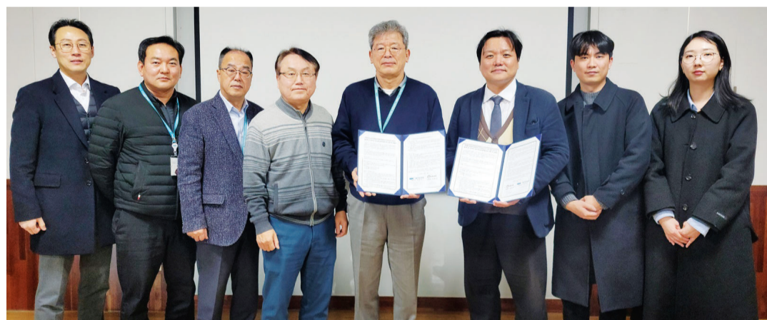
국립목포대학교 화합물반도체센터가 국내 화합물반도체 전문기업인 웨이비스(대표이사 한민석)와 협약을 맺고, 국내 반도체 연구 역량을 강화하기로 했다.