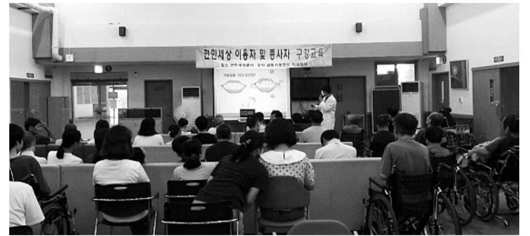
남원시보건소가 편한세상 이용자와 종사자를 대상으로 구강교육을 진행하고 있다.

남원시보건소가 거동하기 불편하거나 구강 관리에 어려움을 겪는 장애인들을 위해 ‘찾아가는 구강보건서비스 사업’을 2025년에도 계속 추진한다. 이 사업은 남원시 관내 장애인종합복지관, 지적장애인협회, 평화의집, 편한세상 등 장애인 시설을 대상으로 진행된다. 전문 치과 공중보건사와 치과위생사가 참여하여 체계적인 구강 건강 관리 서비스를 제공한다. 주요 서비스 내용은 ▲구강보건 교육 ▲구강검진 ▲불소도포 ▲틀니 관리 요령 ▲치주질환 예방을 위한 스케일링 등으로 구성됐다. 시설별 방문