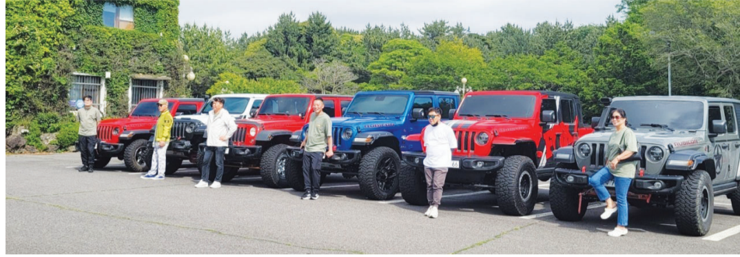
광주·전남 지프차 동호회 '레코알오프로드' 팀.

레코알오프로드 팀은 겨울철 폭설 시기 아무 대가 없이 고랑에 빠진 차량 구조에 나서서 '자원봉사 구조대'로 활약한다. 커뮤니티에 도움을 요청하는