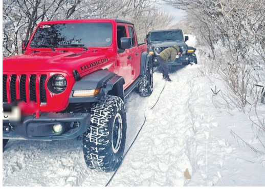
고랑에 빠진 차량을 구조하고 있는 지프 랭글러.

폭설이 내렸던 지난 9일 광주 무등산 정상 부근의 고랑에 차량 한대가 빠졌다. 눈이 많이 쌓인 탓에 119, 군부대, 무등산관리공단도 차량 진입이 어려워 구조가 불가능한 상황이었다. 아무도 손을 쓸 수 없던 이때 지프차 3대가 출동, 견인 장치를 이용해 차량을 끌어올렸다. 광주·전남 지프차 동호회 '레코알오프로드' 팀 회장 김기모(42)씨, 박정호(48)씨, 양기홍(63)·박민경(56)씨 부부였다. 이들은 지프 랭글러 커뮤니티인 네이버카페 '랭글러메니아'에서 구조 요청 글을 보고 팀원들과 함께 자진 구조에 나섰다.