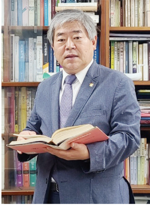
전에 큰 도움이 될 수 있습니다.”

“4차 산업혁명 시대에 대학도서관은 온라인 데이터를 수집하고 분석하는 빅데이터의 온상입니다. 빅데이터를 생산하고 활용 시스템을 구축해 서비스하는 과정까지가 대학도서관의 역할이죠. 이런 의미있는 자료를 대학구성원뿐 아니라 지역사회에 오픈하는 것은 의미있습니다. 지역 커뮤니티 발