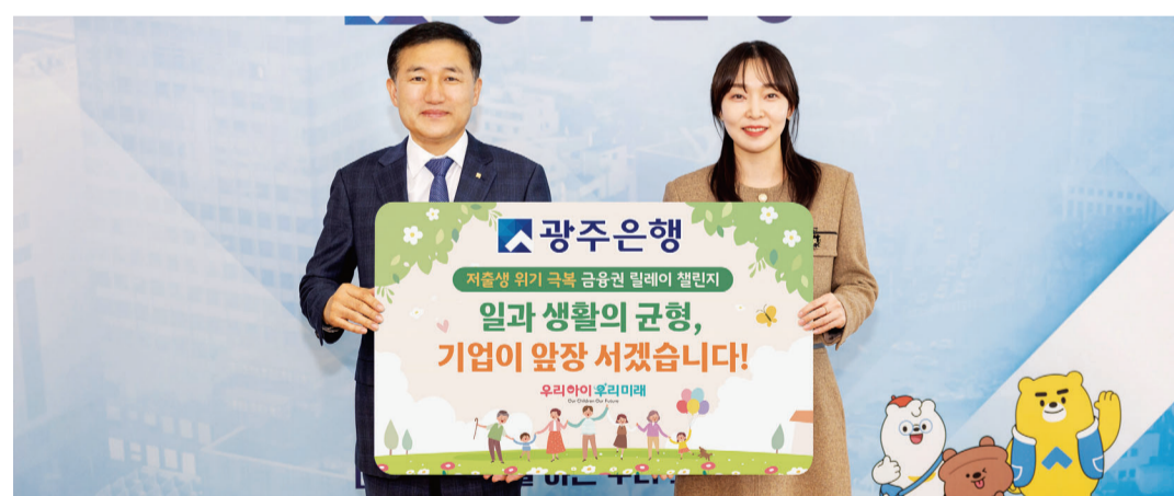
광주은행이 13일 저출생 위기 극복 및 일·가정 양립 문화 확산을 위한 '저출생 위기 극복 금융권 릴레이 챌린지' 캠페인에 동참했다.