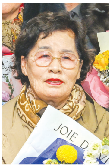
사진들이 졸업 앨범에 가득 담겼다.

최고령 학생으로 교육공 표창장을 수상했다. 가난한 농부의 8남매 중 2녀로 태어난 그는 동생들을 뒷바라지를 하다 국민학교를 중퇴했고 4년 전 TV에서 학교 소개 프로그램을 보다 당장 배우고 싶은 마음에 문을 두드렸다. 글자만 겨우 알던 그는 6개월 가량 초등 교육을 거친 후 중학 과정으로 진학했다. 지난 3년간 월-수요일 오전 9시부터 12시 반까지 국어, 수학, 사회, 과학, 영어, 회화 등 중학교 교과목 수업을 받고 중간·기말고사까지 모두 치렀다. “그동안 어떻게든 기회가 있으면 공부하려고 했는데, 힘들게 살다보니 나이 먹은지도 몰랐습니다. 책가방 챙겨 등교할 땐엔 대통령도 안 부러워요. 공부하고 시험 보는 게 너무 어려웠는데, 쑥쑥 이해할 때까지 친절하게 알려준 선생님들께 정말 감사합니다.”