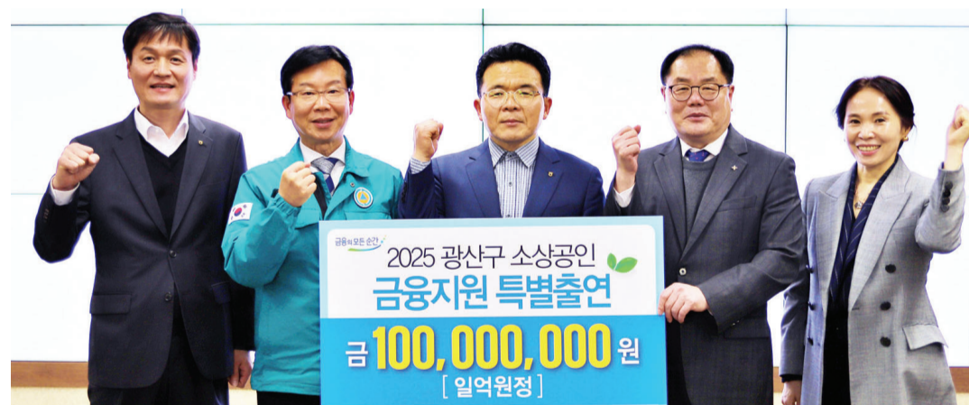
NH농협은행 광주본부는 지난 17일 광산구청에서 광산구, 광주신용보증재단 등과 ‘2025년 광산구 소상공인 상생 특례보증 협약식’을 갖고 특례보증 협약을 체결했다.