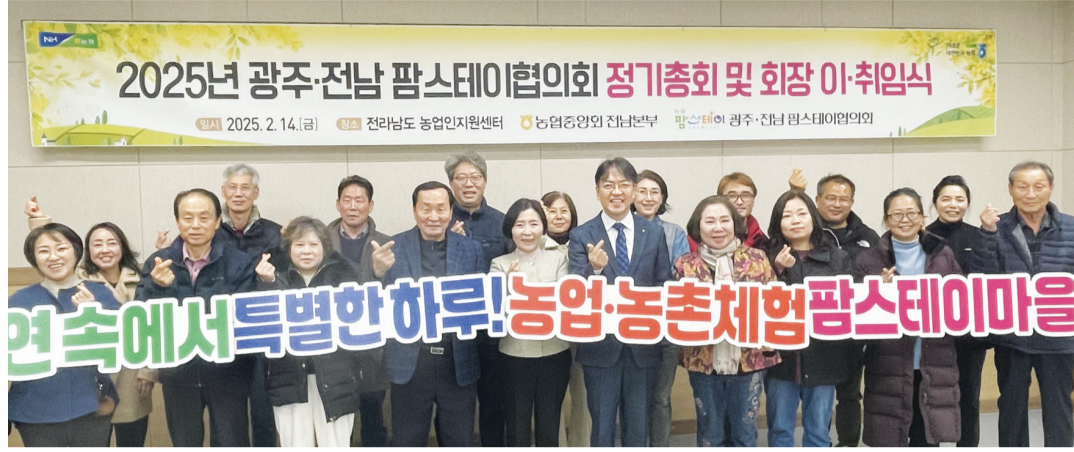
14일 전남도 농업인자원센터에서 열린 광주·전남팜스테이협의회 정기총회 및 회장 임명식 모습.

심 대표는 지난해 협의회 부회장으로 전남 팜스테이 마을을 두 번씩 순회하며 발전 방안을 모색했