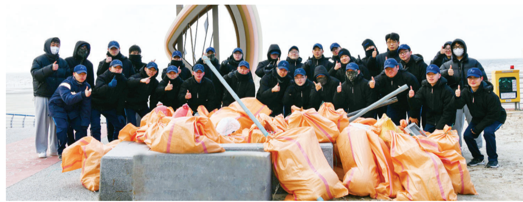
공군 제1전투비행단은 지난 18일 고창군 해리면 소재 동호해수욕장을 찾아 해수욕장 일대에 방치된 해양쓰레기를 수거하는 등 환경정화 활동을 실시했다.