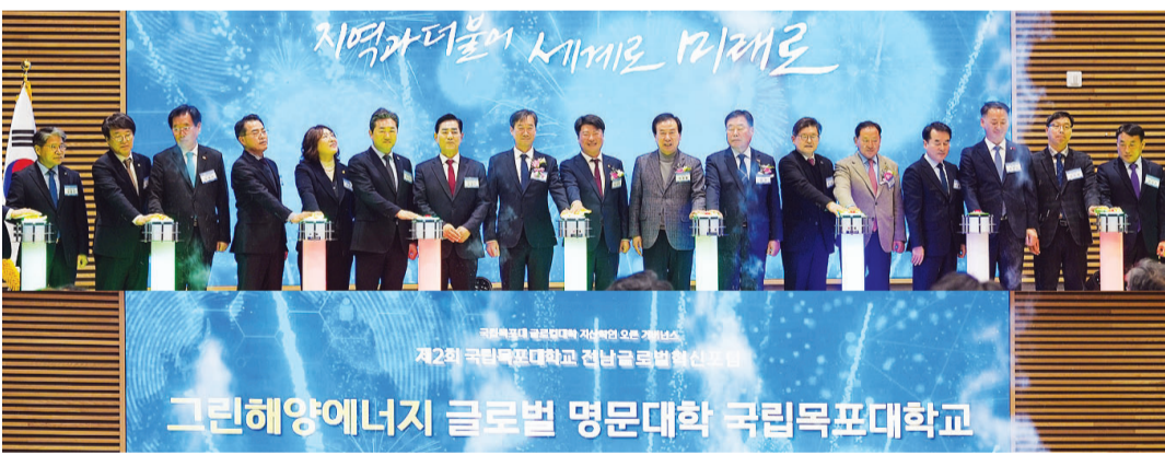
국립목포대학교(총장 송하철)는 전남도와 공동주관으로 지난 18일 국립목포대 70주년기념관에서 '제2회 전남 글로벌 혁신포럼'을 개최했다.