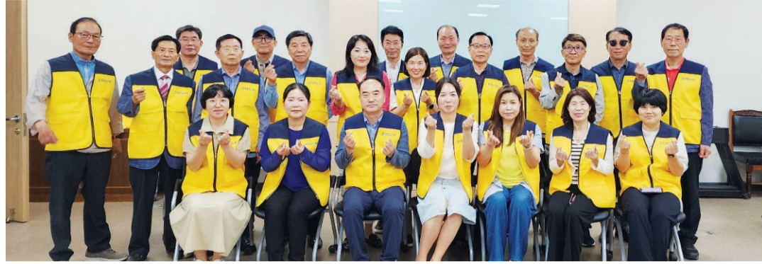
광주시 남구 학생들에게 평화 통일 교육을 진행하는 평화 도슨트 1기 강사들.

위촉된 통일 시민강사들은 대부분 40대에서 70대로 퇴직 공무원·교장 등도 많다. 도슨트는 2인 1조로 한 반을 맡아 PPT 교안과 교구를 활용해 수업을 진행한다. 1차시에서는 통일 관련 국제 정세, 우리는 북한을 어떻게 바라봐야 할 것인가, 평화는 왜