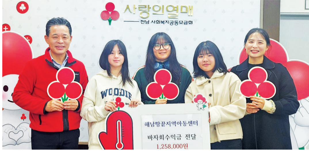
해남땅끝지역아동센터는 최근 전남 사랑의열매에 바자회 수익금 125만8000원을 전달했다.

품을 받는 경우가 많은데, 아이들이 받는 걸 당연하게 생각할까봐 걱정했어. 하지만 아이들이 그 마음을 잊지 않고 기부를 통해 나누는 소중한 경험을 하고 있습니다. 아이들에게 '너희가 누군가를 돕고 있어'라고 말해주면 눈이 초롱초롱해집니다."