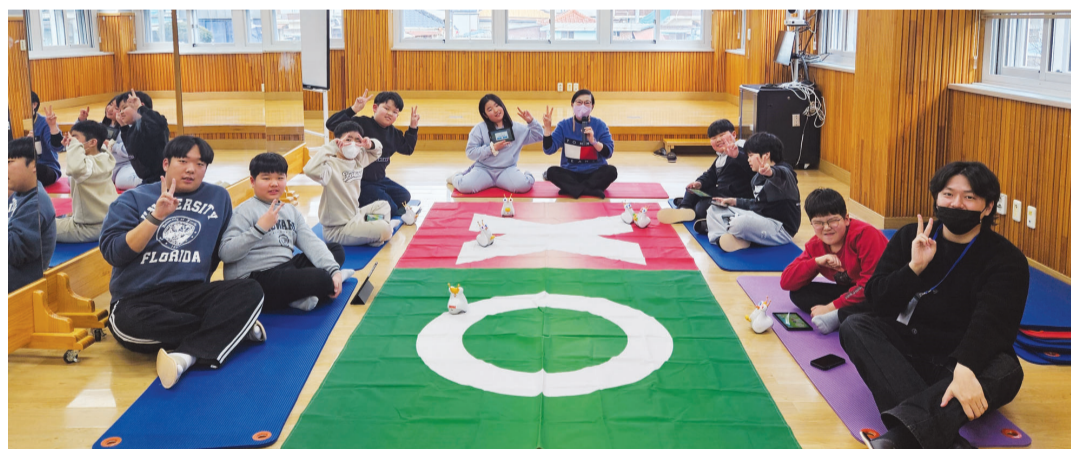
조선대학교(총장 김춘성)가 곡성 초등학교와 함께하는 ‘2025 로보트로 만드는 스마트곡성길’ AI·SW코딩캠프를 마무리했다.