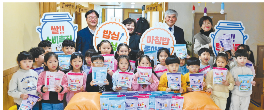
농협광주본부(본부장 이현호)는 24일 광주시 북구 두암동 해솔유치원에서 어린이와 학부모를 대상으로 우리 쌀 소비 확대 캠페인을 진행했다.