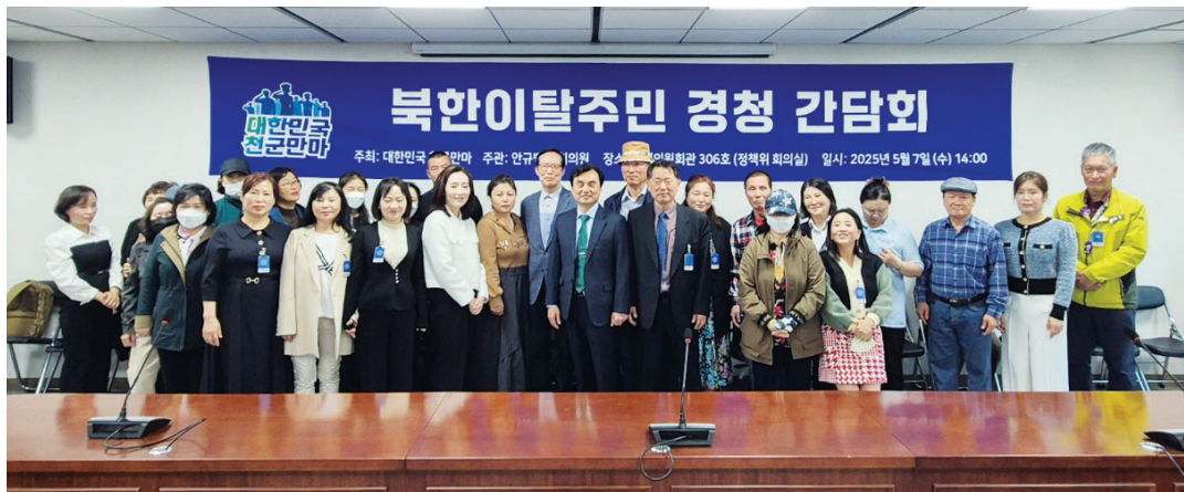
민간 국방·안보 전문가단체인 ‘대한민국 천군만마’는 7일 국회 의원회관에서 ‘북한이탈주민의 정착과 자립 지원 방안’에 대한 경청 간담회를 개최했다.