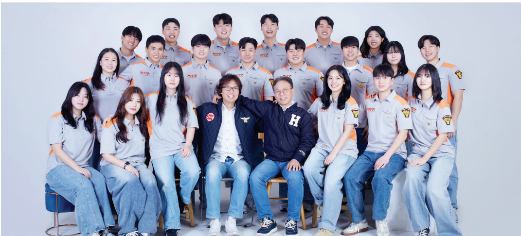
지역사회 소방안전을 위해 힘을 보태고 있는 호남대 대학생전문의용소방대.

“재난 없는 세상을 만드는 안전 설계와 예방 활동에 대해서도 더 깊게 고민하고 있습니다. 현장 경험의 축적을 통해 향후 사회사의 안전을 지키는 든든한 파트너로 자리 잡아가는 게 목표예요.”