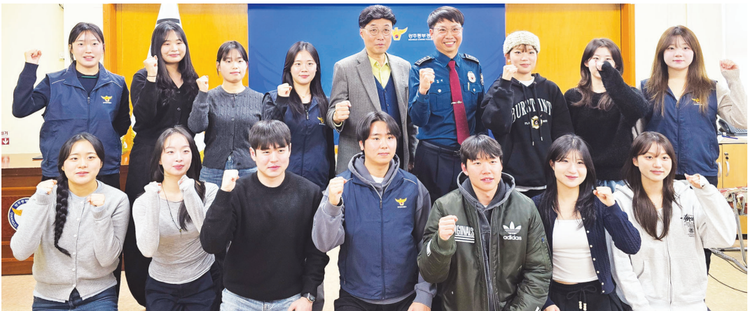
광주동부경찰서는 지난 8일 조선평대학교 경찰행정학과 재학생 15명을 대상으로 15주간 진행한 ‘경학실습학점제’의 수료식을 개최했다.