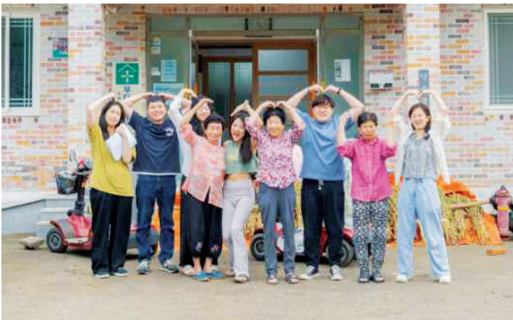
청년마을 ‘전체차랩’ 회원들이 주민들과 마을회관 앞에서 함께 환하게 웃고 있다.

초기 지역 사회의 반응은 엇갈렸다. 일부 주민들은 이들을 잠재적 경쟁자로 인식하거나 단기 체류